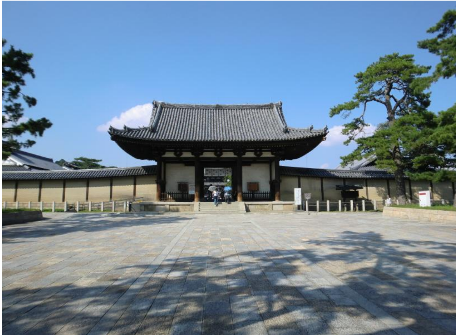
南大門(国宝/室町時代)