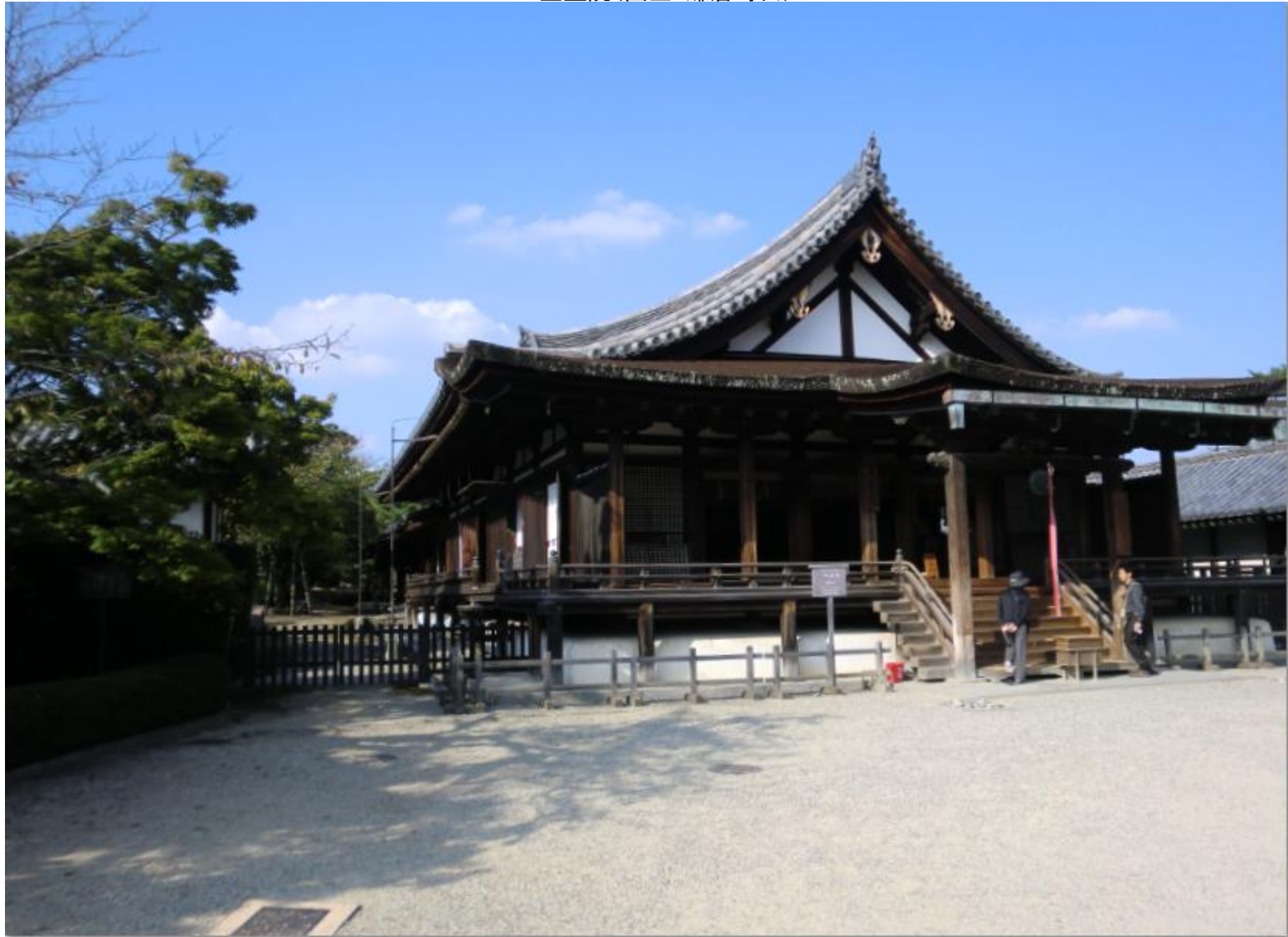
聖霊院(国宝/鎌倉時代)