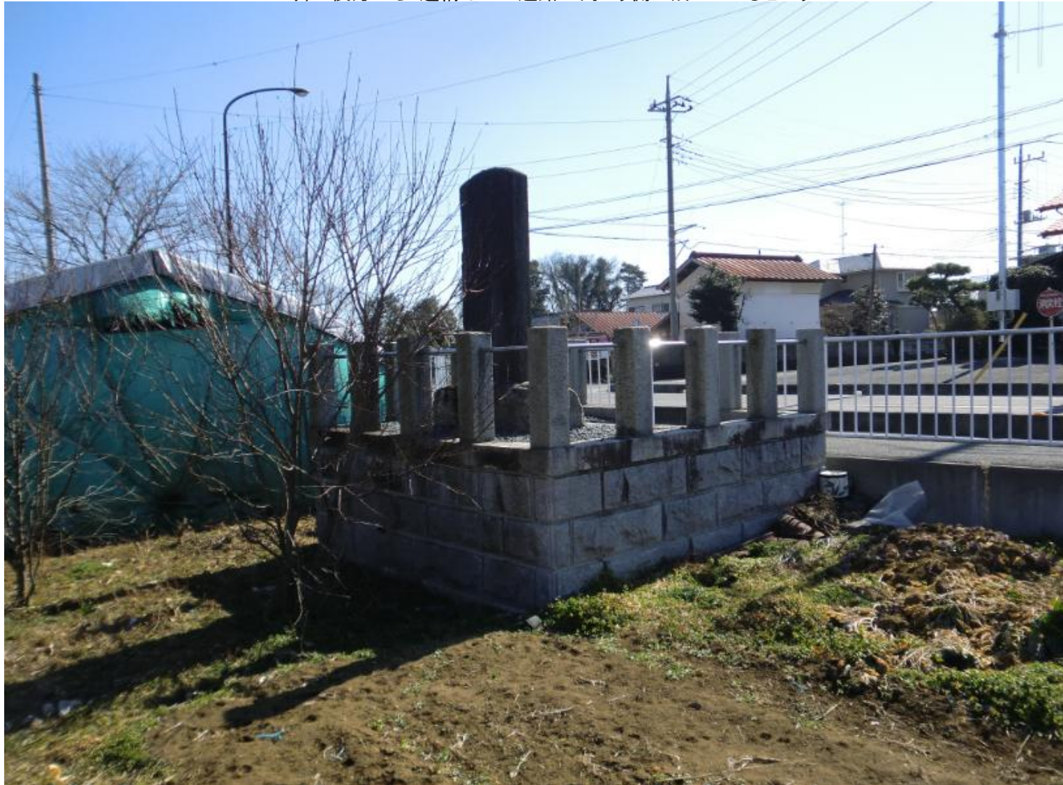
斜め後方から/遺構はこの道路の向こう側に残っているという