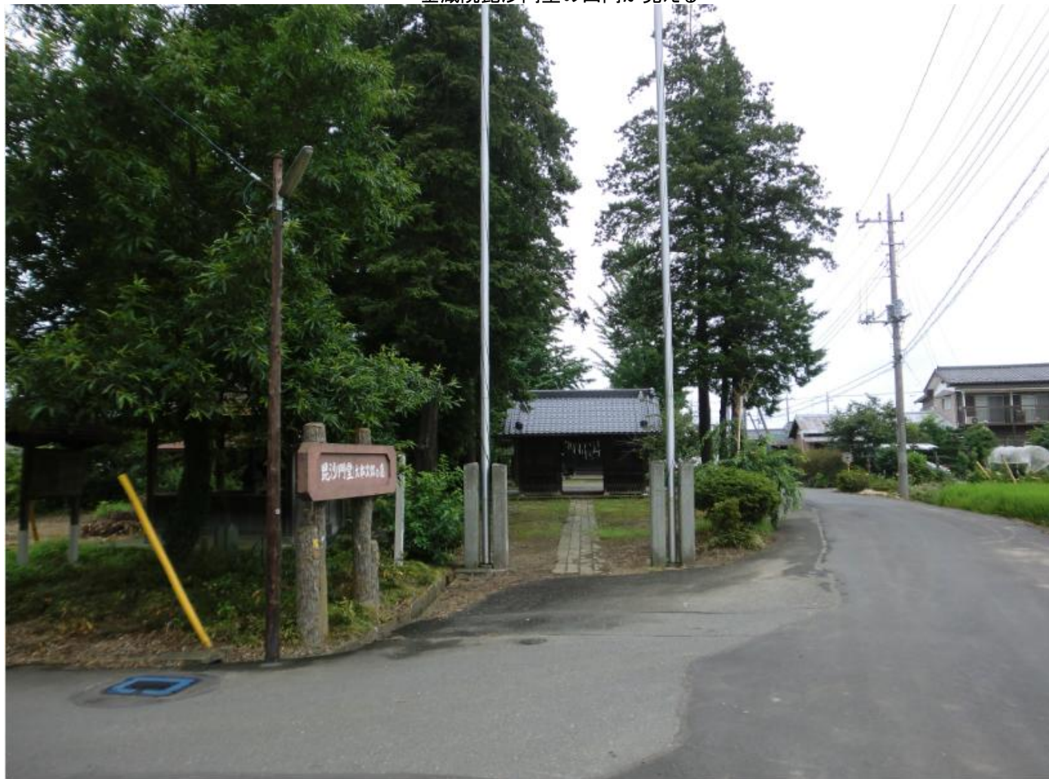
金蔵院毘沙門堂の山門が見える