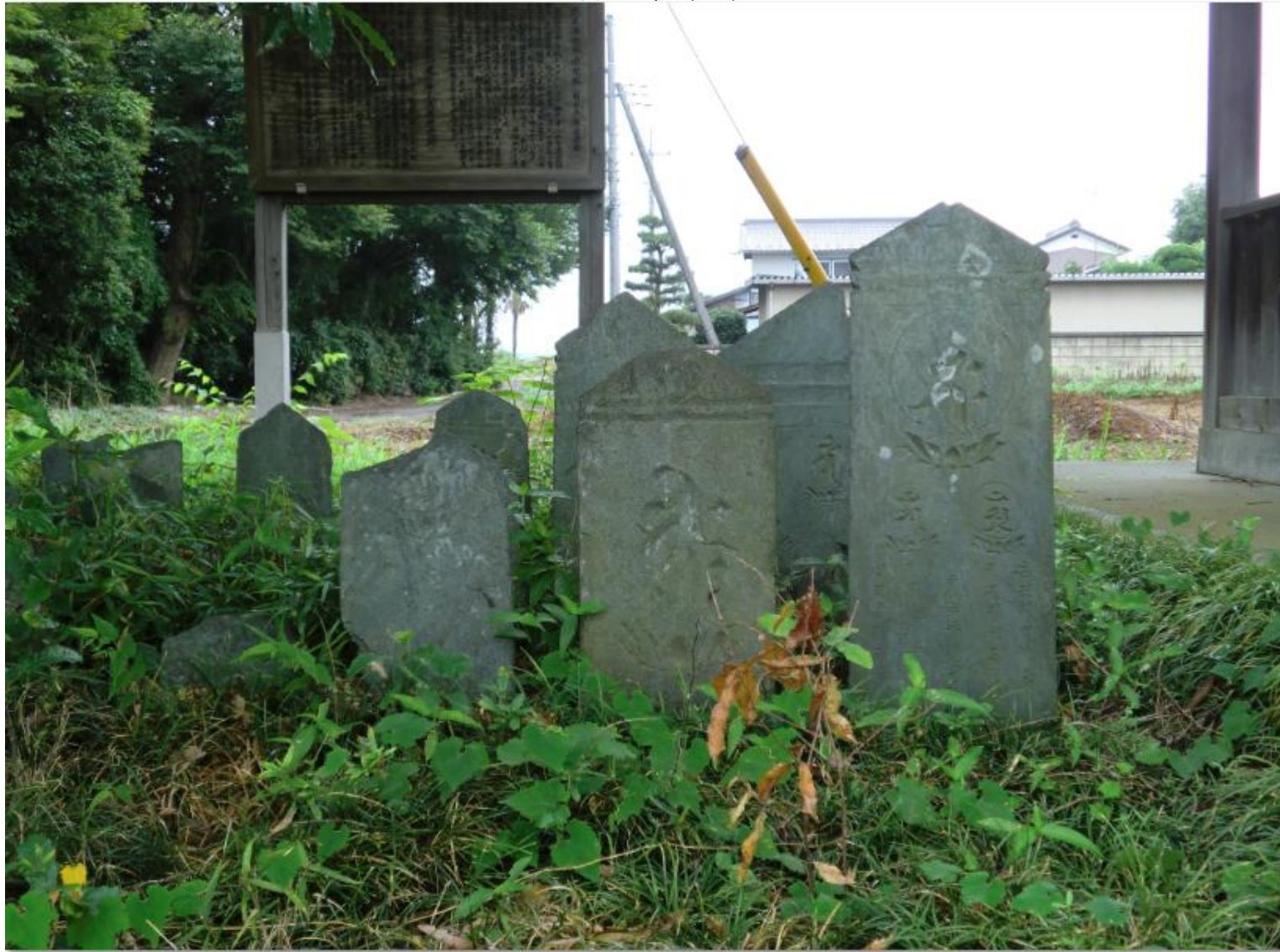
沢山の板碑もある