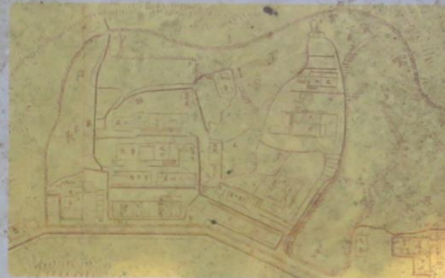
明治初期の学房跡周辺の建物