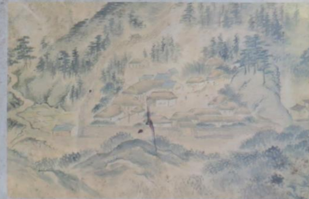
1813年（文化10年）ごろの学房周辺のようす（『開谷学園』より） 備前焼瓦葺（校厨門）、黒瓦葺（校厨・米蔵など）、茅葺（学房など）が区別されてい

Lined up west of the fire prevention embankment were such areas used by students and teachers in their day to day lives and learning as the Gakubō (student boarding house), Shūji-sho (calligraphy and reading area), Kōchū (kitchen), dining hall, rice granary, store house, teacher and executive lodgings, visitor lodgings, Kōchūmon Gate, and rear gate. Many of these buildings were simple thatched roof constructions. Many of the buildings were destroyed in a fire that occurred on March 12, 1847, but were later rebuilt.