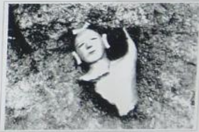
5号窯跡人物埴輪出土状況