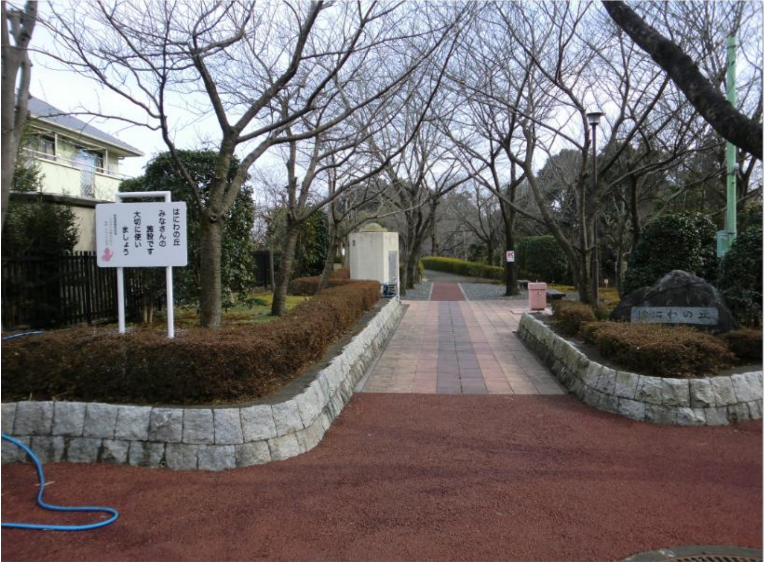
「はにわの丘」とある