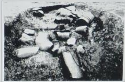
7号窯跡埴輪出土状況

住居跡は窯跡群より一段高い平坦地で北西側に位置し、一辺3~5.8m、深さ0.3m程の方形で、煮炊きや暖をとるカマドが設けられています。埴輪づくり職人の工房跡とみられ、材料となる粘土や道具を保管していたとみられます