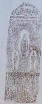
建長二年 庚戌三月 成

板石塔婆は、鎌倉時代から戦国時代にかけて、死者の追善供養や死後の極楽往生を願って造立された石製の供養塔婆です。この地域では、緑泥片岩を使用した武蔵型板石塔婆が盛んに作られました。