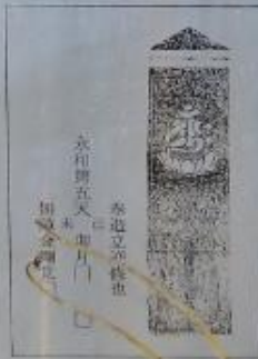
奉造立者終世 永和五年 己未卯月 成

二 胎藏界大日三尊を梵字で表し全体に端正に作られています。上部の主尊は胎藏界大日如来で、その下の脇侍は右が不動明王、左は薬師如来です。紀年銘は、永和五年(一三七九)己未卯月と刻まれています。板石塔婆造立の最盛期のものです。主尊は天台密教系の宗派で良く用いられるもので、当時の多様な宗派活動の様子がかがえ貴重なものです。高さ一九七cm・幅四九cm・厚さ七cm。