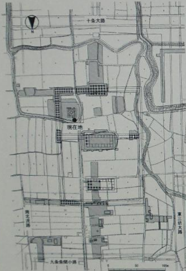
大官大寺伽藍配置図

大官大寺は、『日本書紀』『元興寺伽藍縁起』などの文献資料に、「だいかんだいじ」あるいは「おおつかさのおおでら」と記されているが、その実態は明らかではない。大官大寺は百濟大寺(吉備池麿寺)から高市大寺、大官大寺、そして大安寺と移転しながら変遷することが記録にあるが、高市大寺については定かではない。