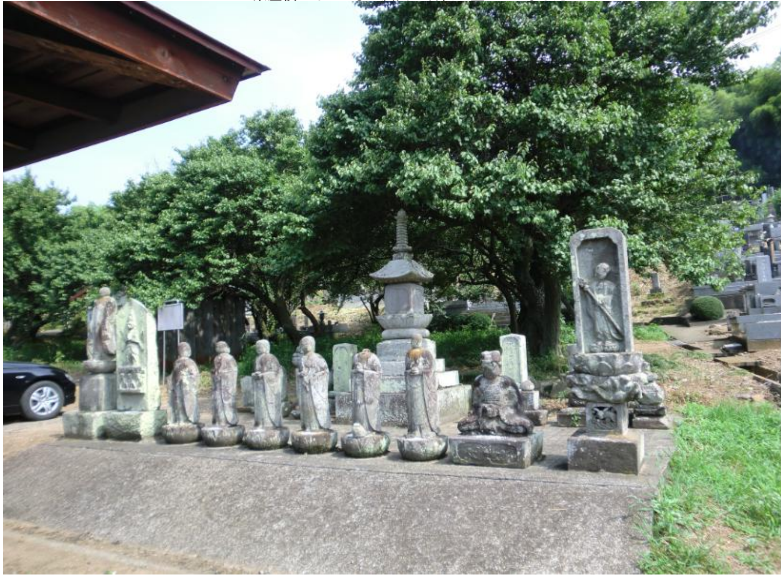
東屋横にはこんなに沢山の石仏が並んでいました