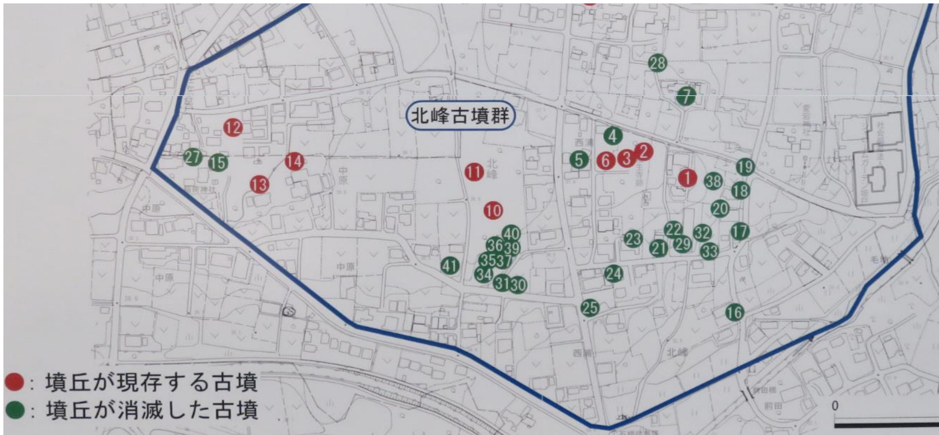
第22回坂戸市埋蔵文化財出土品展のパネルより