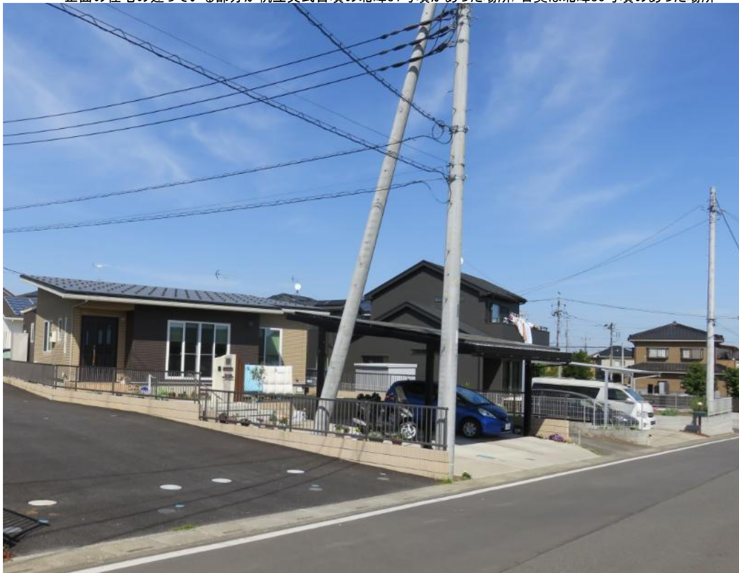
正面の住宅の建っている部分が帆立貝式古墳の北峰31号墳があった場所/右奥は北峰30号墳のあった場所